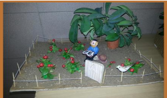
שמיטה ואיכות סביבה, רכסים