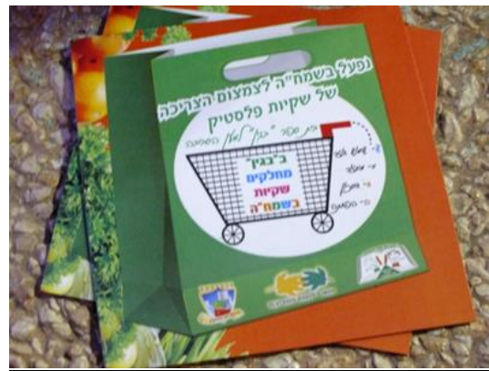
קמפיין להפחתת השימוש בשקיות פלסטיק ברשת מזו פרויקט קהילתי-סביבתי, בייס בגין, קריית מוצקין