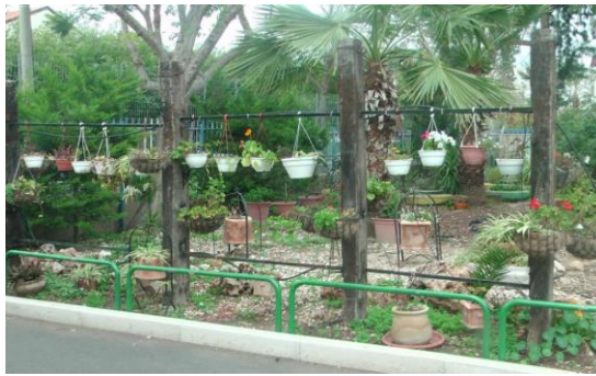
גינה תלוייה, בייס קדימה, קריית ביאליק