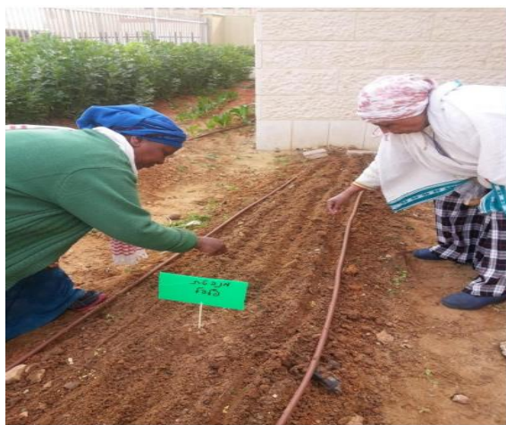
גינה קהילתית, צור שלום, קריית ביאליק