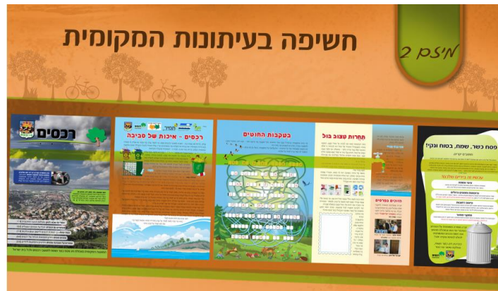
עיתונות מקומית ירוקה , רכסים