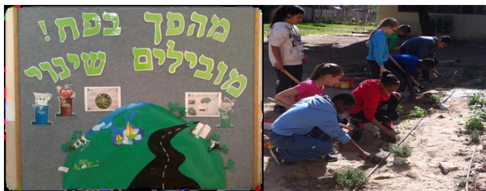
נראות ירוקה, בי"ס הבונים, חיפה