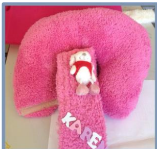
ערכה משלימה לחגורת בטיחות, אורט מדעים ומנהיגות, דליית אל כרמל

מוצר נוסף שראוי לציון וזיכה את מפתחיו במקום הראשון בתחרות הוא ערכת המשחק 'מדן ועד אילת' של חטיבת ביניים 'אורט נתניהו' מקריית מוצקין. זהו משחק קופסא המלמד על זהירות בדרכים, איכות הסביבה וידיעת הארץ.