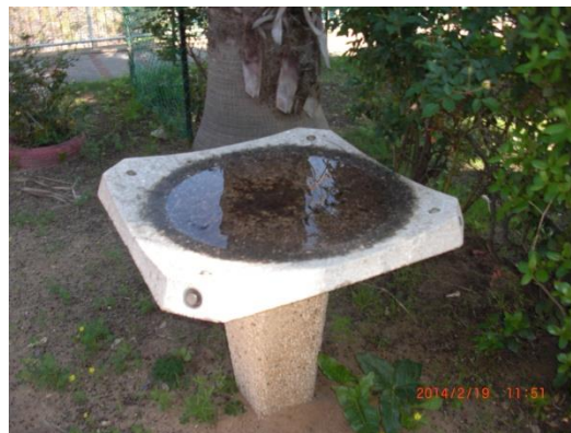
מקור מים לריבוי יתושים