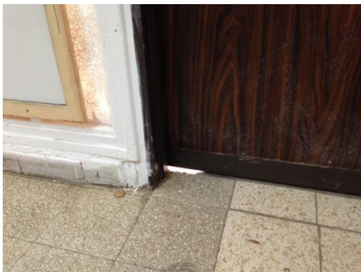
כניסה חופשית לעכברים