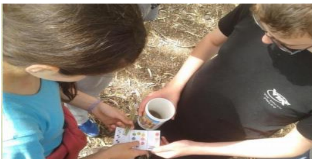
ניטור מי נחל, אימוץ הגדורה, קריית ביאליק