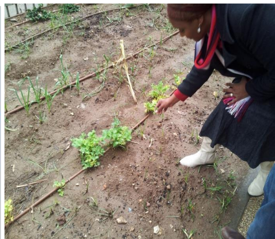
גינה קהילתית במרכז מורשת, קריית ים