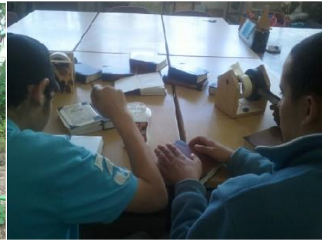
התיקון הכללי- פרויקט קהילתי-סביבתי לתיקון השבת ספרי קודש לקהילה, בייס אבן גבירול, חיפה