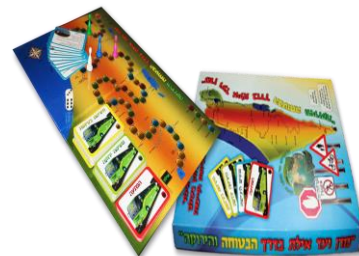
'מדן ועד אילת', חטי"ב נתניהו, קריית מוצקין