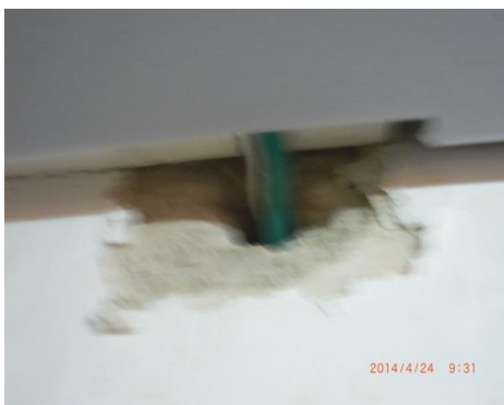
ליקויים במבנה- מסתור וגישה למזיקים